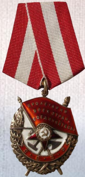
Орден Красного Знамени (21.02.1945)