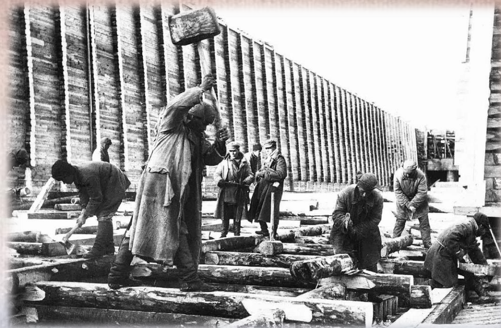
Беломоро-Балтийский исправительно-трудовой лагерь (Белбалтлаг)