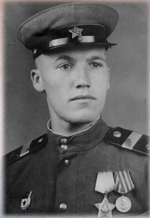
Герой Советского Союза Кузнецов Николай Иванович (1911-1944)

В центре произведения Дмитрия Медведева - образ Героя Советского Союза Н. И. Кузнецова, спецагента НКВД, разведчика отряда «Победители».