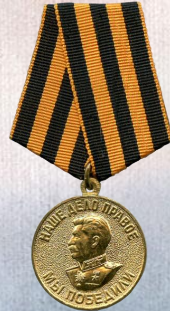
Медаль «За победу над Германией в Великой Отечественной войне 1941-1945 гг.»