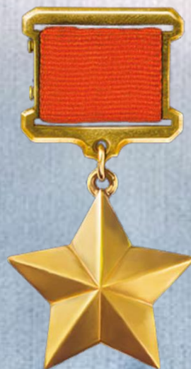
Медаль «Золотая Звезда» Героя Советского Союза № 4513 (05.11.1944);