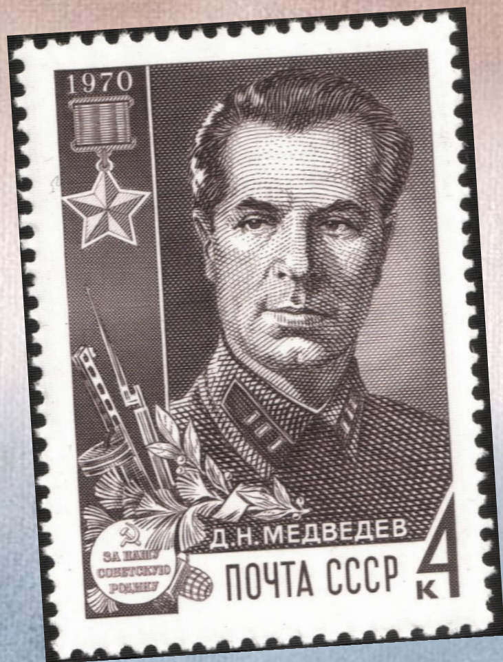
Марка, изданная в серии «Герои Советского Союза»

Дмитрий Николаевич Медведев за боевые заслуги был удостоен звания Героя Советского Союза. Навыки проведения успешных боевых действий пригодились в 1945 году во время борьбы с литовскими «лесными братьями».