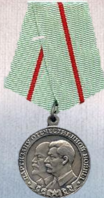
Медаль «Партизану Отечественной войны» I степени